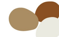
ovos de granja